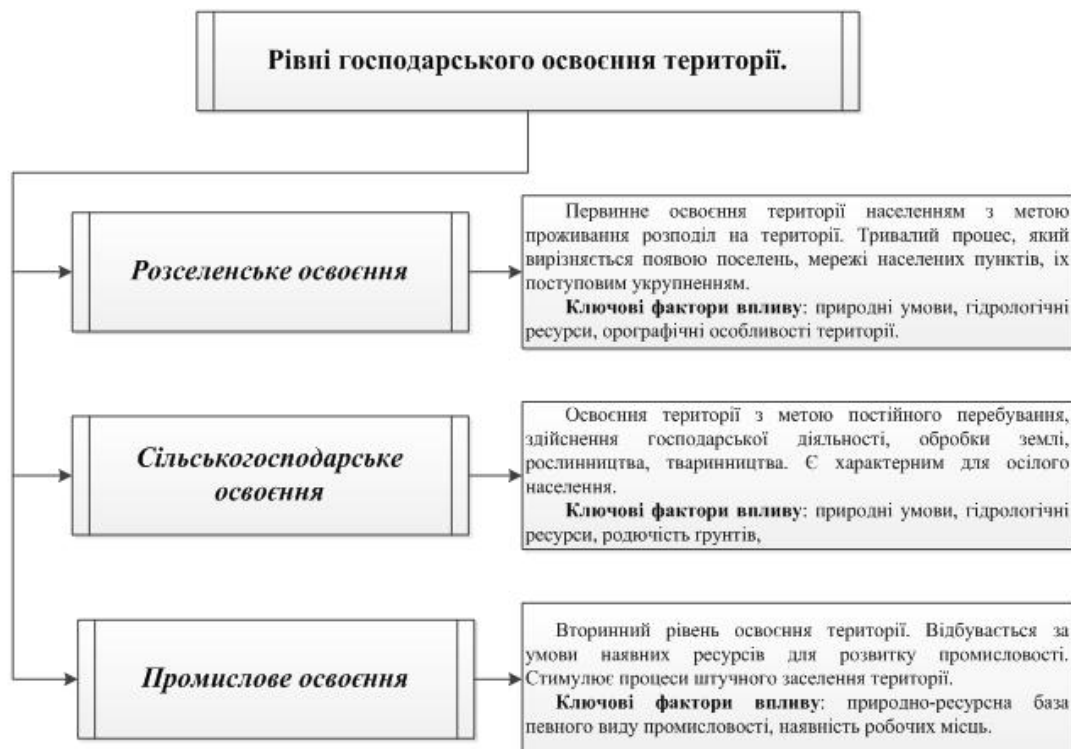
Рис. 1. Рівні господарського освоєння території (побудовано за даними [2, 6, 8]).

6). Надання пільг добровільним мігрантам у XVII ст.