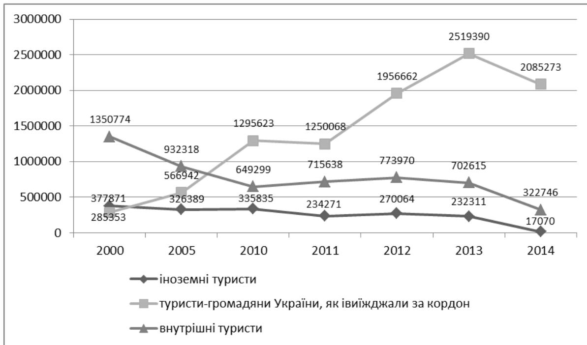
Рис. 4. Динаміка туристичних потоків по Україні [8]

них пам'яток, наприклад заповідник «Михайлівська цілина», Яблуна-колонія, Шелеховське озеро тощо, а також храмів та церков, які являються витворами архітектури, що в свою чергу приваблюють віруючих та туристів.