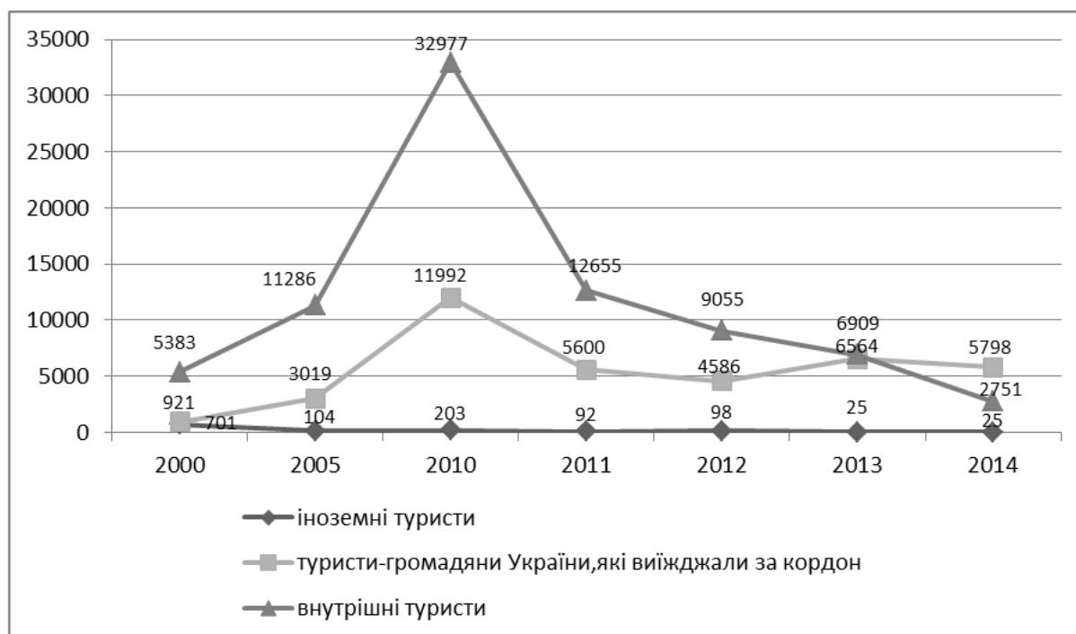
Рис. 3. Динаміка туристичних потоків за видами туризму в Сумській області [3]