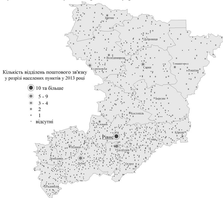
Рис. 2 Відділення «Укрпошта» у Рівненській області Побудовано за матеріалами [3]

міських населених пунктах. У сільській місцевості розташовано майже 85 % усіх відділень «Укрпошта» Рівненщини (рис.2) і середня забезпеченість сільського населення такими відділеннями по області становить близько 3 одиниць на 10 тис. осіб. Проте забезпеченість населення відділеннями «Укрпошта» по території області не рівномірна (рис.1): від 0,9 відділень на 10 тис. осіб у Рівному до понад 6,0 у Дубровицькому, Зарічненському, Млинівському, Гощанському та Корецькому районах.