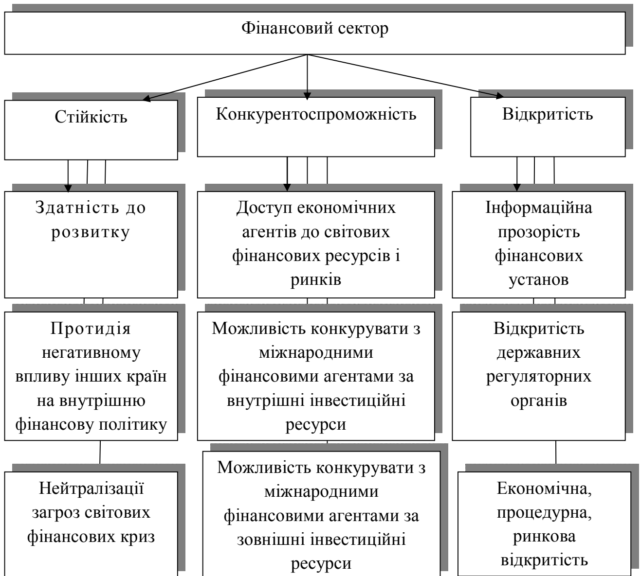
Рисунок 3. Фінансовий сектор як стабільна складова комерційного підрозділу соціального комплексу