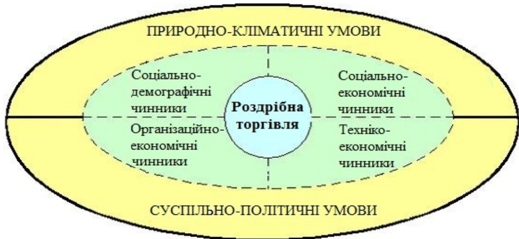
Рис.1 Умови та чинники, що впливають на розвиток роздрібної торгівлі Складено за матеріалами [4]

причини, що обумовлюють характер впливу на функціонування і розвиток галузі. Між ними існує певний діалектичний зв'язок, що виражається в тому, що умови організації роздрібної торгівлі визначають кількість і характер угруповання факторів, які впливають на її функціонування. На нашу думку, склад чинників, які формуються під впливом певних умов, що впливають на функціонування і розвиток роздрібної торгівлі, виглядає наступним чином.