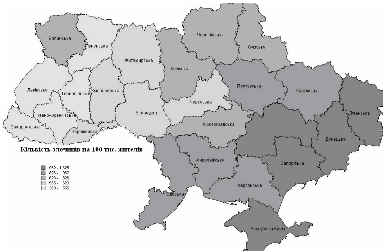
Рис. 2 – Рівень злочинності в регіонах України у 2010 році

Для порівняння показників шлюбності, розлучуваності та злочинності з рівнем релігійності в регіонах України, на основі методу ранжування було виділено наступні групи регіонів за кількістю релігійних громад на 100 тис. жителів (рис. 3). Першу групу з найвищими показниками склали: Волинська, Тернопільська, Хмельницька, Чернівецька та Закарпатська області; до другої групи увійшли регіони із значною кількістю релігійних громад : Рівненська, Львівська, Житомирська, Вінницька та АР Крим, до третьої групи увійшли регіони з незначною кількістю релігійних громад : Івано-Франківська, Київська, Черкаська, Полтавська та Херсонська області; четверту групу склали регіони з несприятливою ситуацією: Сумська, Кіровоградська, Одеська, Миколаївська та Запорізька області; до п'ятої групи увійшли регіони з найнижчими показниками : Чернігівська, Дніпропетровська, Луганська та Харківська області.