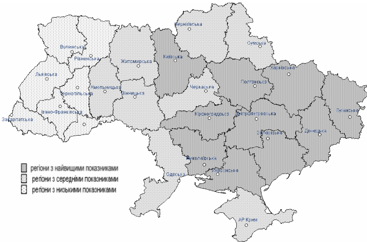
Рис. 1 – Групи регіонів України за рівнем розлучуваності

Віросповідне самовизначення має виразну регіональну специфіку. Так, найбільше число православних є характерним для Півдня (76%), Центру (74%) і Сходу (72%), на Заході їх частка становить лише 46%. Послідовники ісламу становлять 5% жителів Півдня і 0,3% – Сходу. Тих, хто не відносить себе до жодного з існуючих віросповідань, найменше на Заході (4%), найбільше – в Центрі (17%) та на Сході (16%) [1].